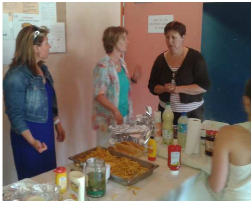
Des frites pour tout le monde.