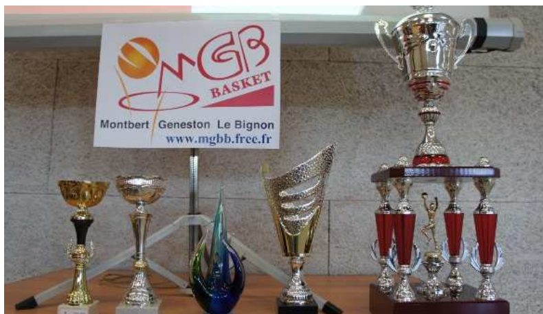
Les minimes F championnes départementales: