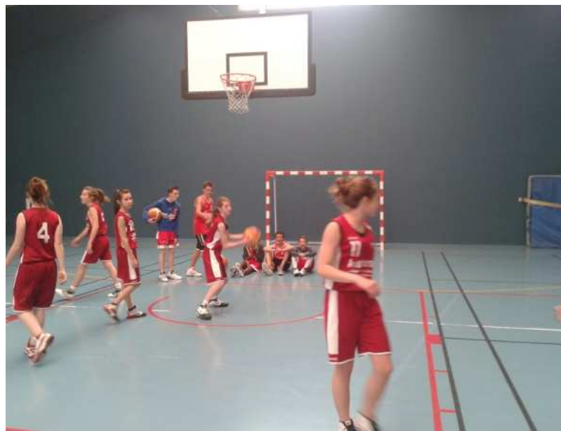
Les minimes F à l'échauffement.