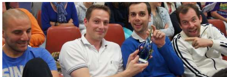
Les Minimes G, avec leur trophée Mie Caline :