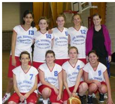
Les cadettes D2

Lorsqu'elles sont prises, il suffit de les adresser ensuite à guy.yhuel@wanadoo.fr qui se chargera de les publier. A découvrir ensuite dans la rubrique Photos