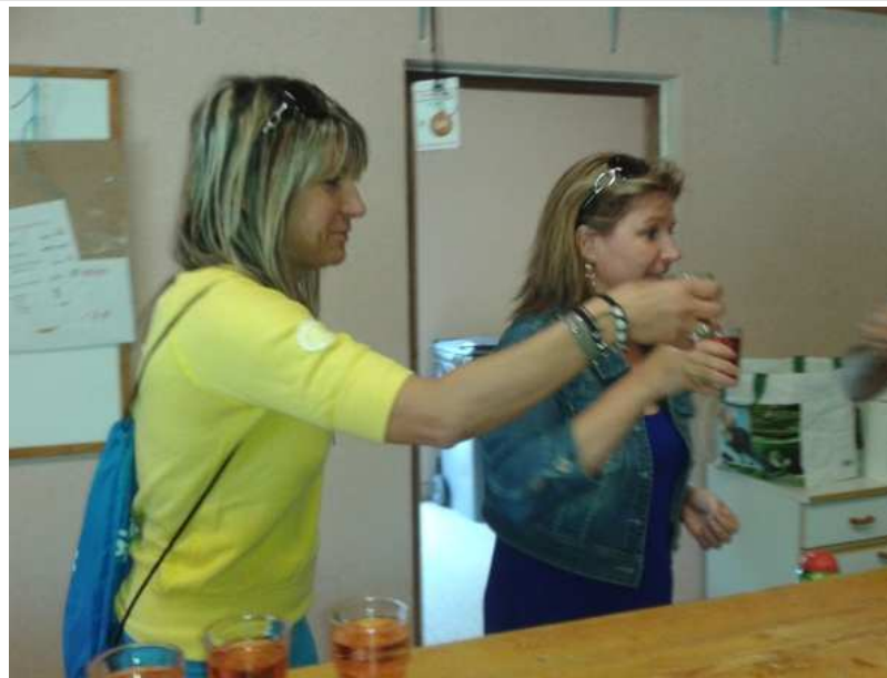
Apéro pour tout le monde!