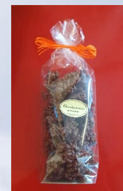
Ballotin de 250 g et 500 g Mendiants lait et noir 100 g Krunch de 100 et 200 g