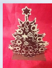
Silhouette en chocolat, hauteur environ 20 cm

* Allergènes présents : fruits à coque, produits laitiers, gluten