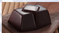
Caramel beurre salé*