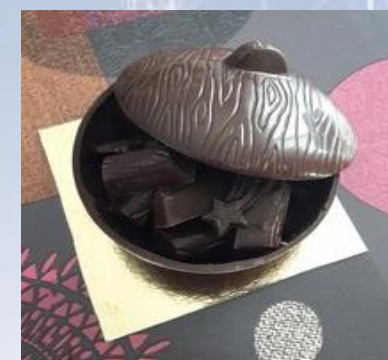
Bonbonnière tout chocolat environ 375 g